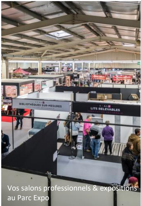
Vos salons professionnels & expositions au Parc Expo