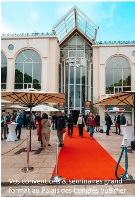
Vos conventions & séminaires grand format au Palais des Congrès vue mer