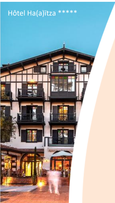
Hôtel Ha(a)ïtza *****