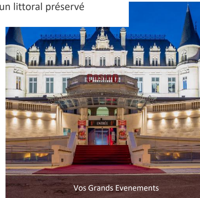
Vos Grands Evénements