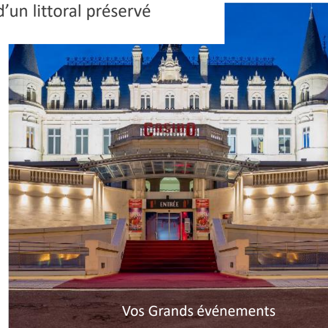
La Teste de Buch