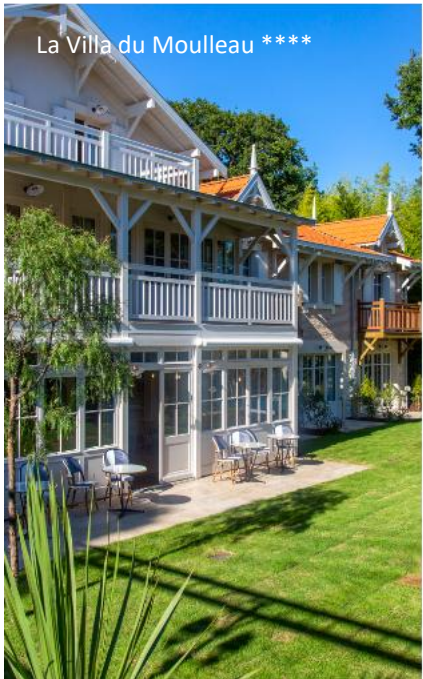
La Villa du Moulleau ****