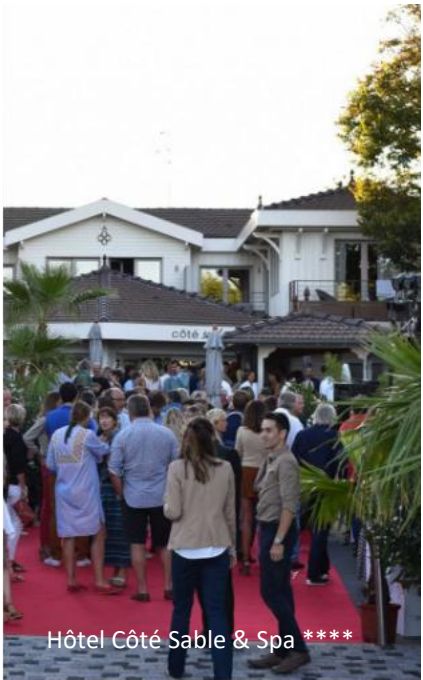
Hôtel Côté Sable & Spa ****