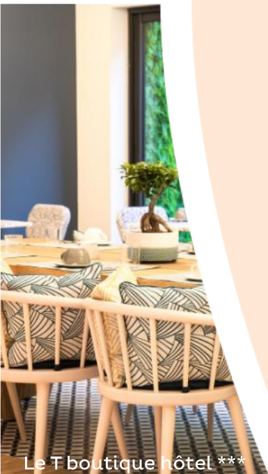
Le T boutique hôtel ***