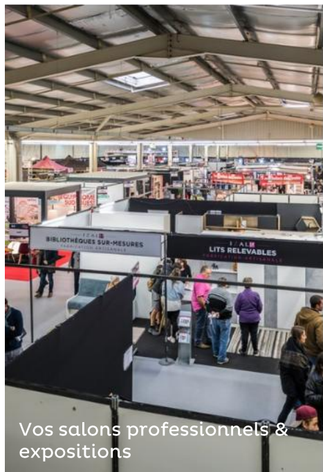
Vos salons professionnels & expositions