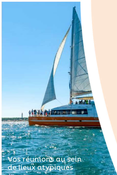
Vos réunions au sein de lieux atypiques