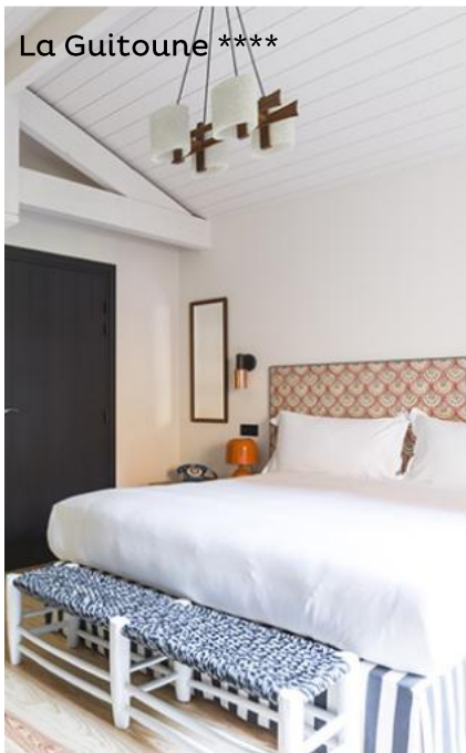
La Guitoune ****