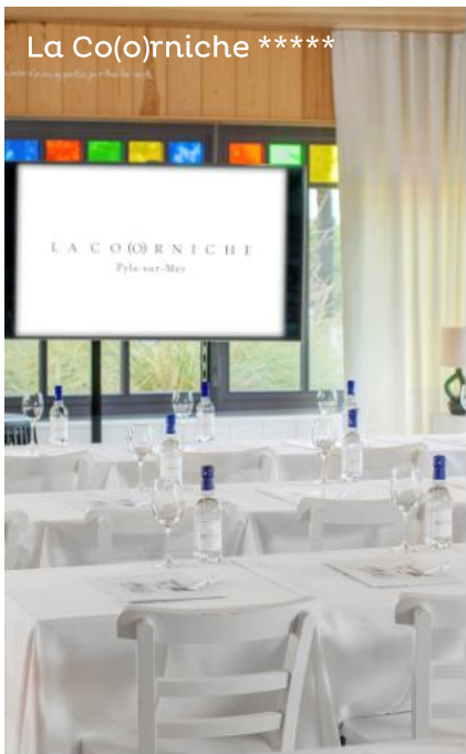
La Co(o)rniche *****