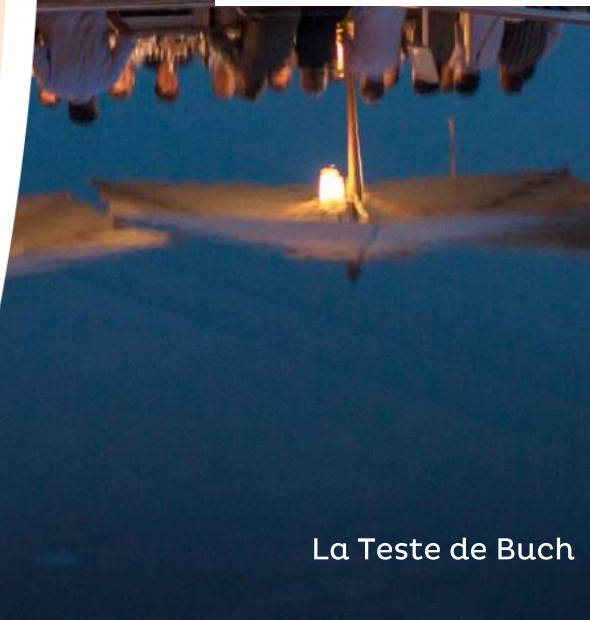
La Teste de Buch