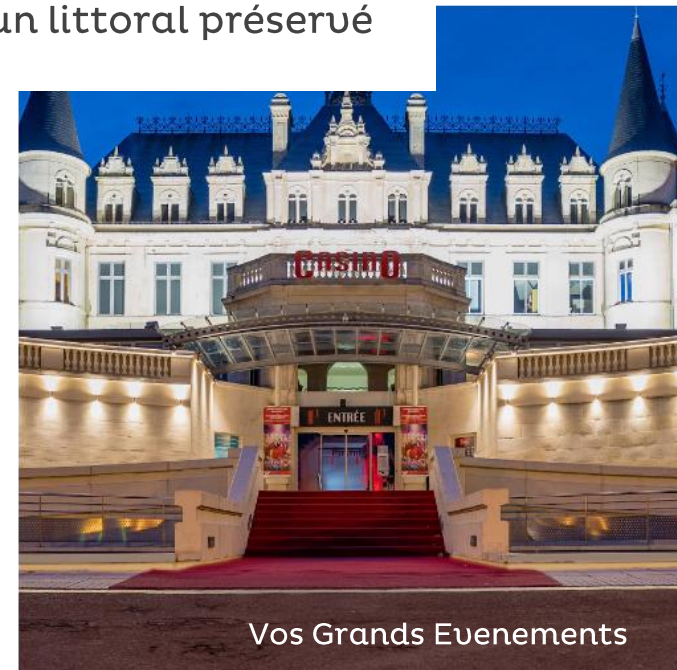
Vos Grands Evénements