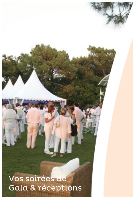
Vos soirées de Gala & réceptions