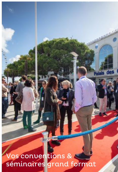
Vos conventions & séminaires grand format