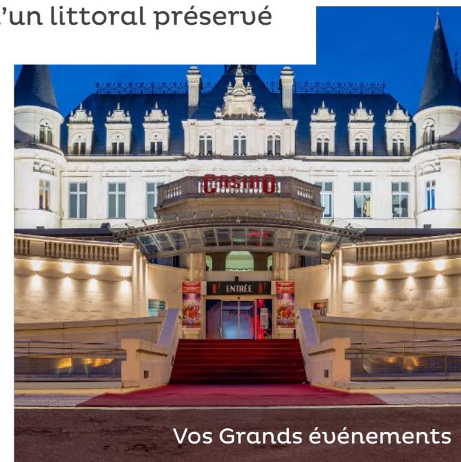
Vos Grands événements