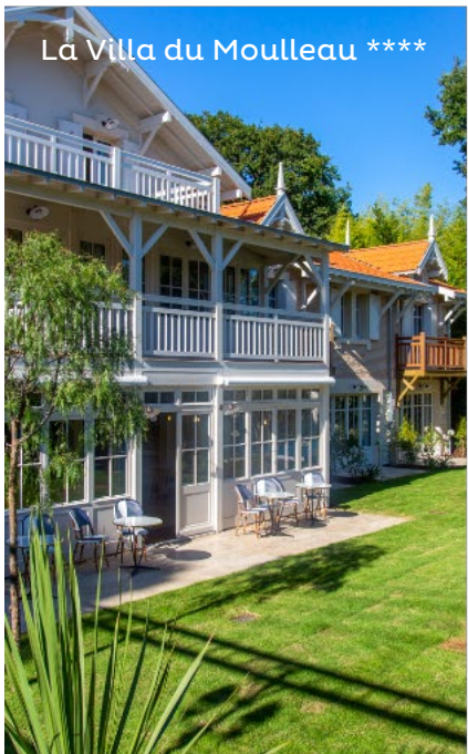
La Villa du Mouleau ****