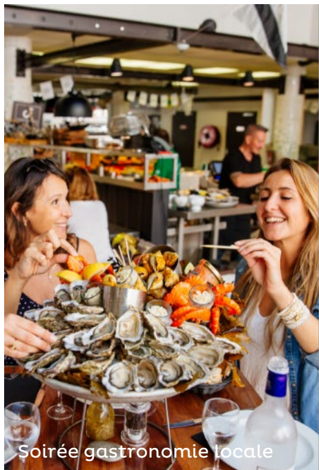
Soirée gastronomie locale