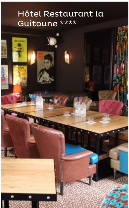
Hôtel Restaurant la Guitoune ****