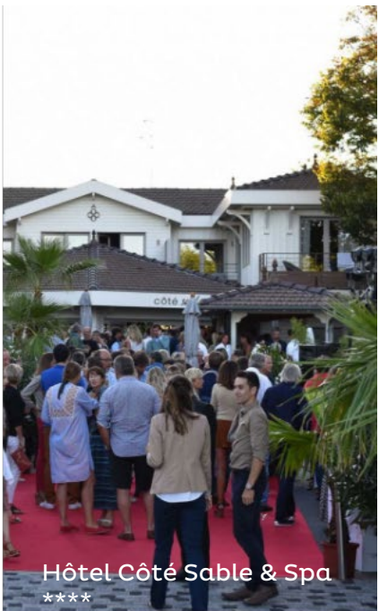
Hôtel Côté Sable & Spa ****