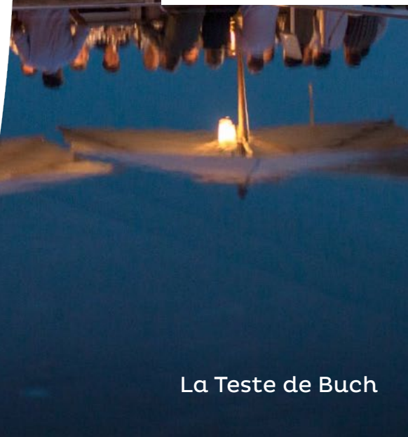
La Teste de Buch