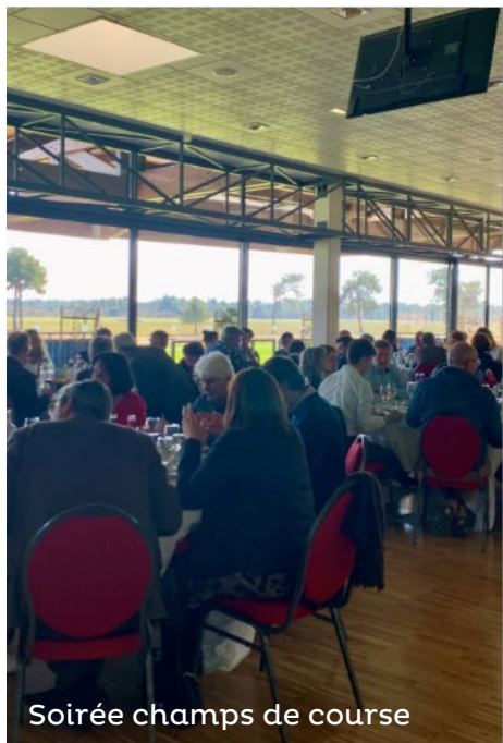
Soirée champs de course