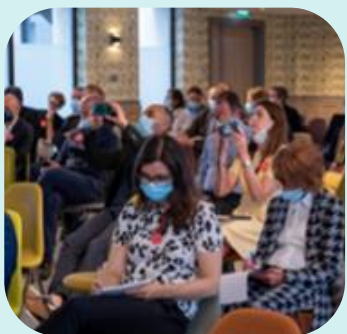
Paris, 22 juin 2021 : Le plaisir et l'intérêt de se retrouver étaient au rendez- vous !