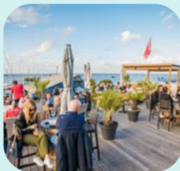
Le Bassin d'Arcachon, une destination durable qui veut engager ses visiteurs !

VALORISATION DES OFFRES DES PARTENAIRES Bassin dans la newsletter de France Congrès et Evénements (FCE)