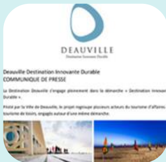
Deauville, Destination Innovante Durable : découvrez les acteurs engagés